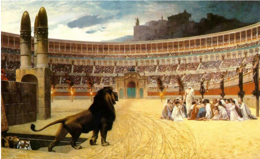
‘Het laatste gebed’, van Jean Leon Gerome.

Keizer Constantijn I gaf het Christendom een legale status via het Edict van Milaan in 313 nChr.