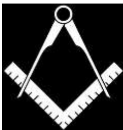
passer en winkelhaak

De vrijmetselarij is een internationaal verband van loges, en staat bekend als een geheim genootschap in minimaal 33 graden, maar is in feite een occulte religie. De vrijmetselaars in de laagste graden krijgen niet de informatie van de hogere graden. Over de graden boven de 33e graad wordt niets bekend gemaakt, deze zijn blijkbaar topgeheim. De leden moeten een eed van geheimhouding afleggen en hebben masonische verplichtingen. De vrijmetselaarswetten gaan voor de grondwetten van een land. Al hun besprekingen en ook hun agenda moeten geheim blijven.