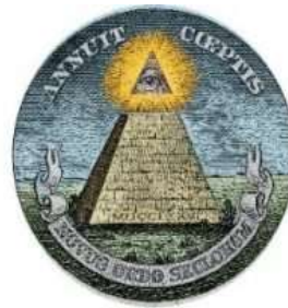
Zohar = occult licht