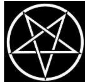
pentagram 5-puntige ster

De geopende passer geeft de graad aan. De G staat voor gnosis, een oud-Grieks woord voor kennis. Rechts afgebeeld is het pentagram, een ster als symbool. Met de punt 'naar beneden' wordt die ster meestal als Satanaanbidding gebruikt.