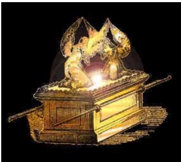
Ark van het Verbond

HerzSt (Psalm 2:6) 6 Ik heb Mijn Koning toch gezalfd over Sion, Mijn heilige berg .