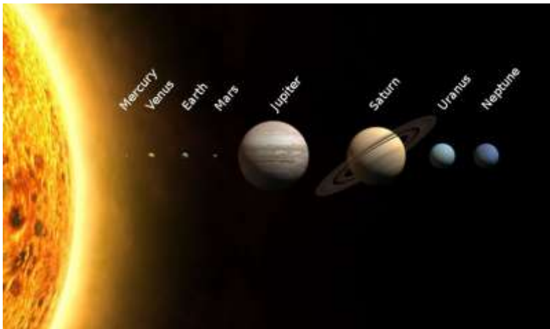
Solar System