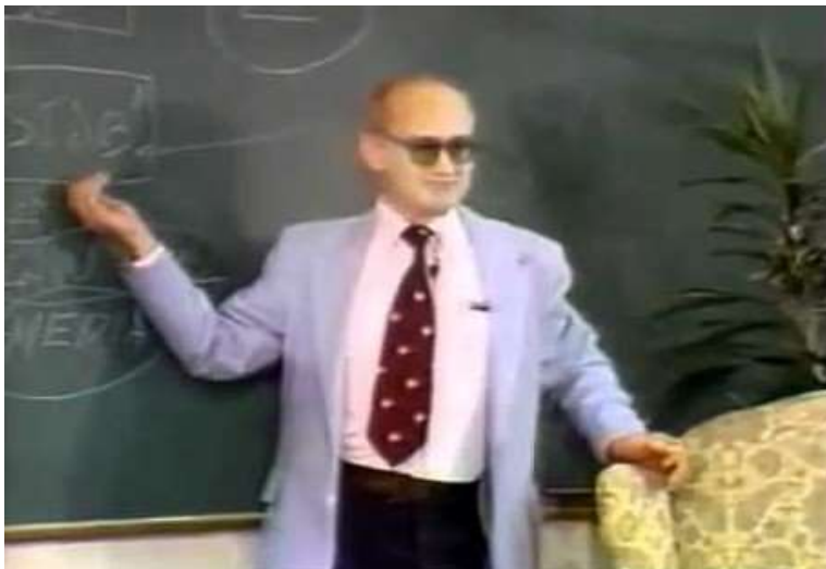
Yuri Bezmenov (Tomas Schuman)

'De hoogste kunst van het oorlogvoeren is helemaal niet om te vechten, maar om zaken van waarde in het land van je vijand te ondermijnen. Of het nu morele tradities, religie, respect voor uw autoriteit en leiders, culturele tradities, wat dan ook zijn.'