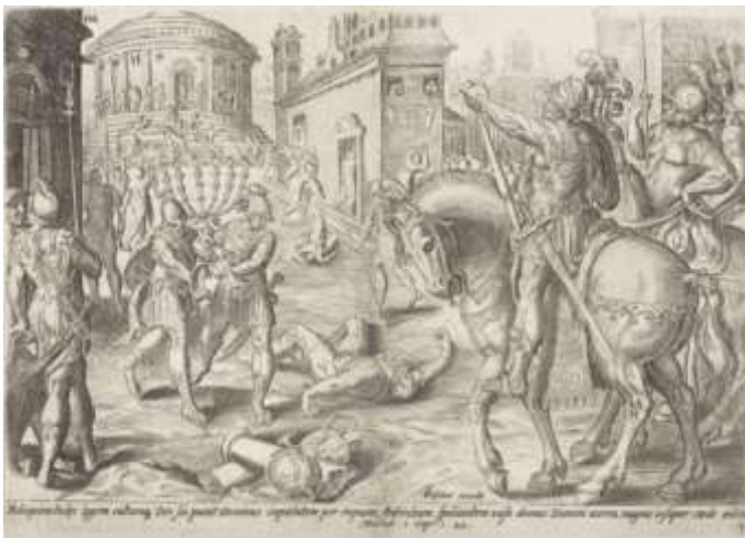
Antiochus IV Epifanes rooft de tempel van Jeruzalem leeg

Nu is 1 Makkabeeën niet geïnspireerd geschreven, maar is geschiedkundig wel helder. Orthodoxe Joden hadden veel bezwaren tegen beoefening van de hellenistische cultuur, die immers talloze goden kende. De Seleucidische koning Antiochus IV Epifanes gaf het bevel om een heidens altaar op te richten in de Joodse tempel te Jeruzalem , gewijd aan de heidense god Zeus (de oppergod van de goden). Hij wilde de heidense aanbidding van Zeus in zijn hele rijk verplichten en verbood het Joodse volk, toen Gods volk, de aanbidding van hun God YHWH. Antiochus IV Epifanes ontheiligde de tempel door de dagelijkse terugkerende offers te verbieden. Hij roofde ook alle kostbaarheden.